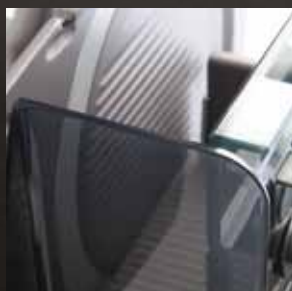
Kein Engpass am Schneidgutdurchlass

Die Schnittstärke ist bis zu hauchdünnen Scheiben im Feinbereich von 0 - 3 mm einstellbar. Eine nachstellbare Schneidgutabstützung mit großer Reinigungsfuge verhindert die Zipfelbildung und ermöglicht ebenso verlustfreies wie hygienisches Aufschneiden. Weder zwischen Schlitten und Anschlagplatte noch hinter den Handschutz kann Ware entweichen.