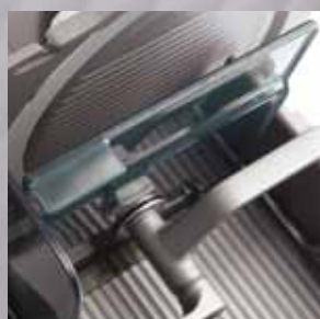
Restehalter mit Magnethalterung