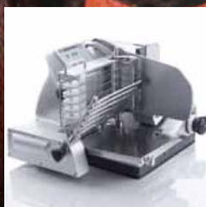
VS 11 A