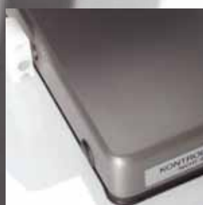
Kompakte Bauweise, leicht zu reinigen

Glatte Oberflächen ohne Ecken und Kanten, absolut unverbaute, frei zugängliche Reinigungsbereiche sowie einfache Demontage einzelner Komponenten, z. B. beim Restehalter über eine Magnetbefestigung. Radien mit weitem Abstand zwischen Messer und Motorturm sowie die kompakte Bauweise mit geschlossenem Aufstellrahmen verhindern Verschmutzungen der Motorsteuerung und unter der Maschine,