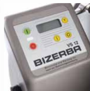
Hubfreie und komfortabel zu bedienende Folientastatur