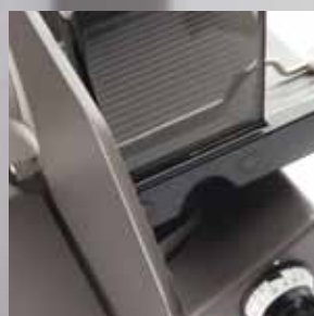
Anschlagplatte im Nu ergonomisch verstellbar

Die niedrige Bauweise, ein leichtgängiger Schlitten und eine ergonomisch verstellbare Anschlagplatte sorgen für eine ermüdungsfreie Bedienung. Der leistungsstarke Motor in Dreh- oder Wechselstromausführung sowie sämtliche Funktionen werden über die leicht zu reinigende, hubfreie Folientastatur gesteuert.