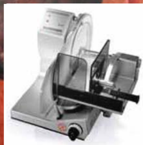
VS 12 F VS 12 F-P