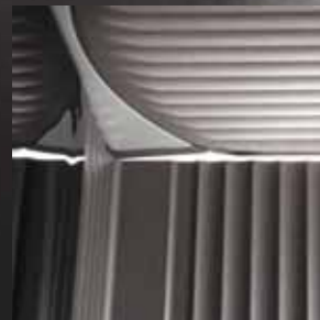
Höchste Präzision an der Schnittkante