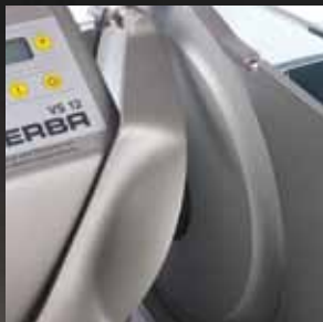
Abstreifer zum Reinigen leicht zugänglich