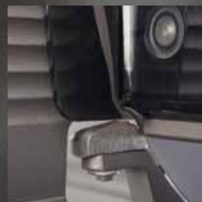
Nachstellbare Schneidgut- stütze für präzise Schnitte