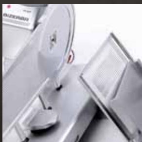
Schlitten zum Reinigen ausklappbar