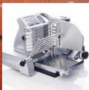
VS 12 A VS 12 D VS 12 D-V