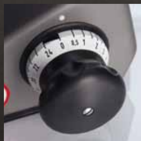
Gespreizte Schnittstärken- skala für exakte Einstell- ung der Schnittstärke