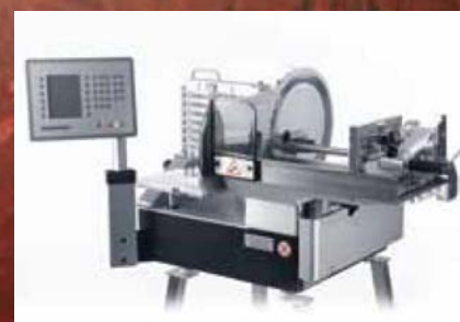
A 400 A 400 FB