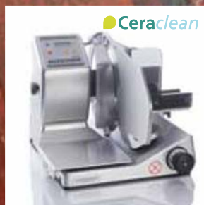
VS 12 VS 12 C VS 12 W VS 12 C-W