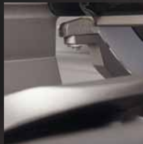
Schneidgutabstützung intelligent integriert