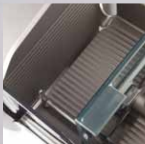
Restehalter und Handschutz auf einer Ebene

Alle eingesetzten Werkstoffe sind in der Praxis nahezu unverwüstlich und sehen auch nach vielen Jahren noch blendend aus. Zusätzlich zur Konformitätserklärung verfügen Bizerba Schneidemaschinen über offizielle Baumuster- und GS-Prüfzeugnisse als amtlichen Nachweis über die Einhaltung sämtlicher Sicherheits- und Hygienevorschriften.