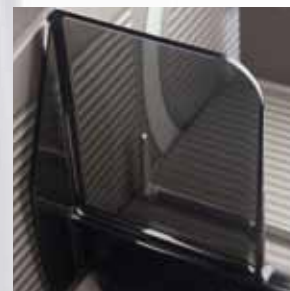
Transparente Makralon Rückwand